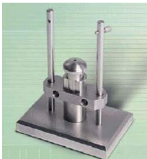
Figura 229 - 2. Fotografía del aparato